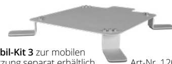
Mobil-Kit 3 zur mobilen Nutzung separat erhältlich Art-Nr. 1201000